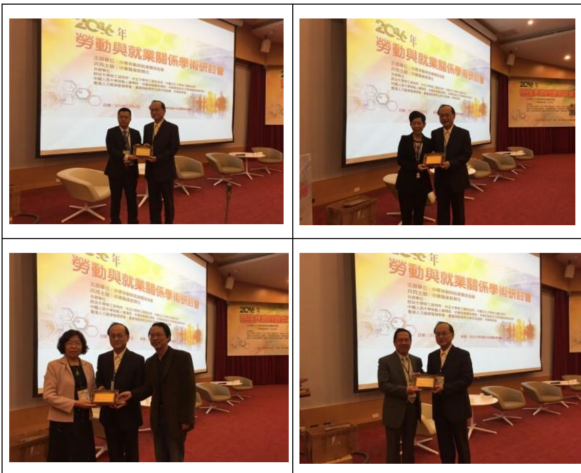
利用中午休息時間，主辦單位致贈紀念牌給共同主辦及合辦單位。