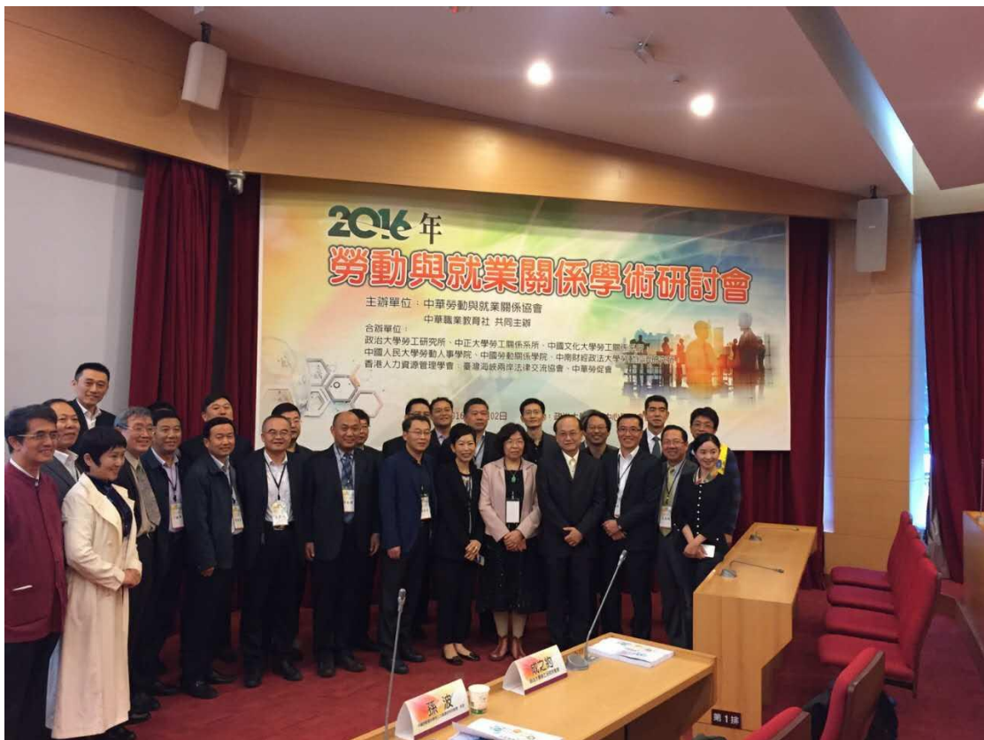
在開幕式結束後，多位兩岸與會貴賓利用茶敘時間所做的合照。